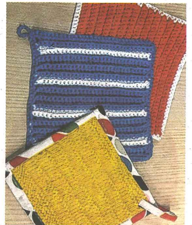
Hilfreich: Topflappen