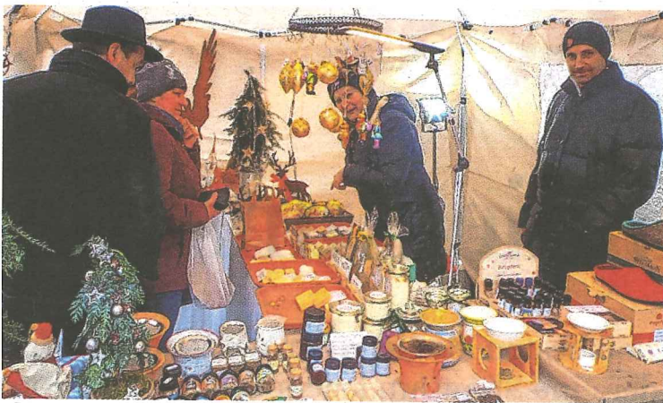
Stimmungsvoll: Kerzen, Duftöle, Seifen