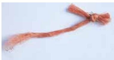
SCHNURFRAGMENT MIT KNOTEN MATERIAL: NYLON ROSA EINGEFÄRBT ALTER: ANFANG 21. Jhd. FUNDORT: NEAPEL