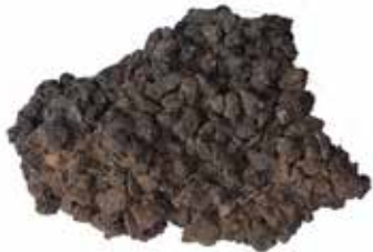
ASFALTKLUMPEN GROSZ MATERIAL: GESTEIN / TEER ALTER: 21. Jhd. FUNDORT: BEI MONESTER S. BENEDETTO