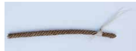
TEIL EINES KULTOBJEKTES MATERIAL: ORGANISCH - KUNSTSTOFF ALTER: ANFANG 21. Jhd. FUNDORT: ATENA