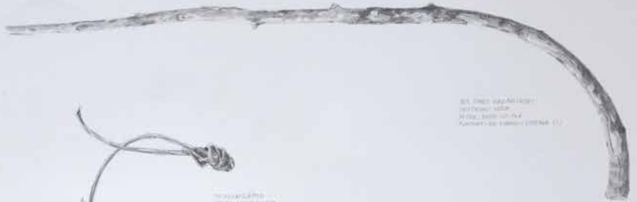
Long, thin, curved object, possibly a branch or stick.