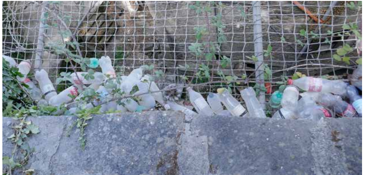
Müllimpressionen aus Paliano, Palestrina, Olevano Romano