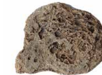
KULTOBJEKT SCHÄDEL MATERIAL: TUFFGESTEIN ALTER: 7TAUSEND v. Chr. FUNDORT: FIUME FIORA BEI VULCI