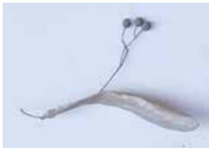
BAUMSAMEN MATERIAL: ORGANISCH ALTER: ANFANG 21. Jhd. FUNDORT: CERVINARA / PALIANO