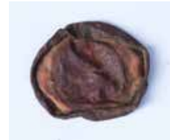
FERSCHLUSSKAPPE MATERIAL: METALL ALTER: ANFANG 2021 FUNDORT: TUSCANIA