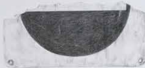
Rectangular object with a dark, semi-circular shape on top.