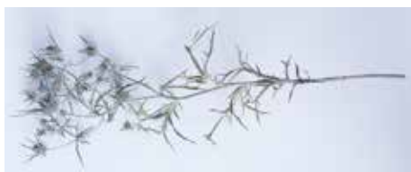
DISTEL MATERIAL: ORGANISCH ALTER: AUGUST 2021 FUNDORT: BELLEGRA