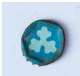
KRONKORKEN MATERIAL: METALL ALTER: ANFANG 21. Jhd. FUNDORT: ROM