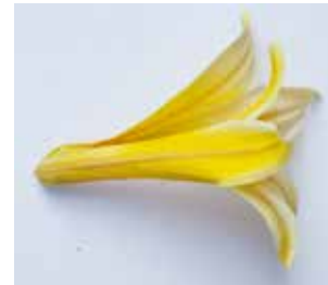
KUNSTSTOFFBLÜTE MATERIAL: KUNSTSTOFFGEWEBE ALTER: ANFANG 21. Jhd. FUNDORT: NEAPEL