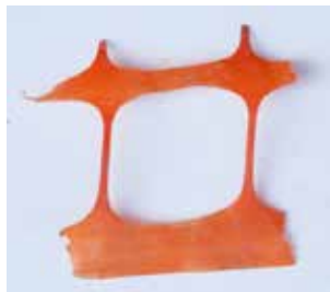
FRAGMENT EINES SCHUTZNEZES MATERIAL: KUNSTSTOFF ALTER: ANFANG 21. Jhd. FUNDORT: ROM