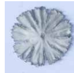
ROSETTE MATERIAL: KUNSTSTOFFGEWEBE ALTER: ANFANG 21. Jhd. FUNDORT: FRIEDHOFSTIEGE BELLEGRA