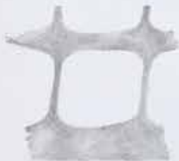
Object with a central square hole and four protrusions.