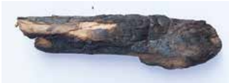
FETISCH - OBJEKT MATERIAL: HOLZ VERKOHLT ALTER: ENDE 20. Jhd. FUNDORT: ROCCA MASSIMA