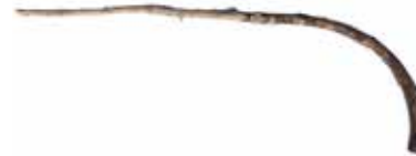
TEIL EINES KRUMMSTABES MATERIAL: HOLZ ALTER: ENDE 20. Jhd. FUNDORT: AM WEG NACH SORANA