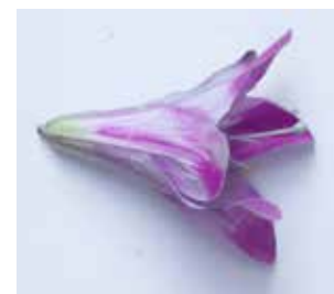
KUNSTSTOFFBLÜTE MATERIAL: KUNSTSTOFFGEWEBE / PLASTIK ALTER: ANFANG 21. Jhd. FUNDORT: FRIEDHOFSTIEGE BELLEGRA