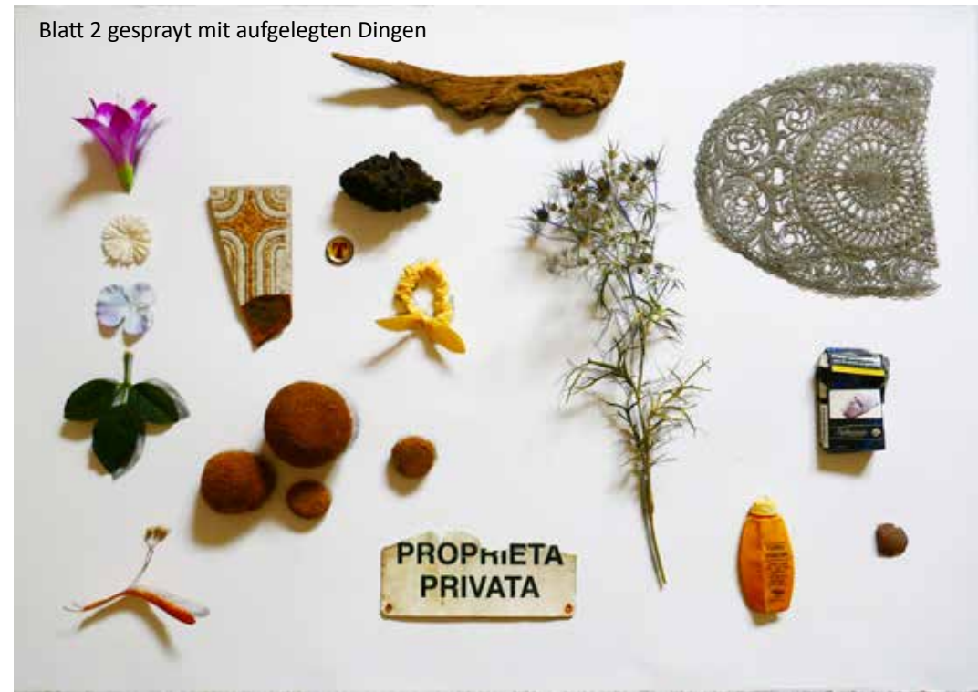
Blatt 2 gesprayt mit aufgelegten Dingen