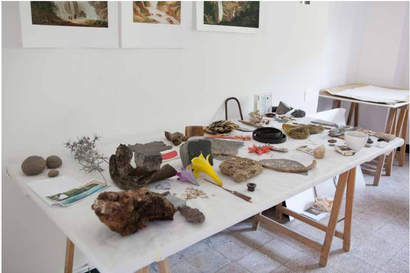
Atelier Paliano, Archivbestände