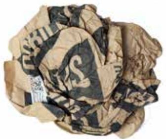
PAPIERKNEUEL MATERIAL: PAPIER / BEDRUCKT ALTER: ANFANG 21. Jhd. FUNDORT: ROM