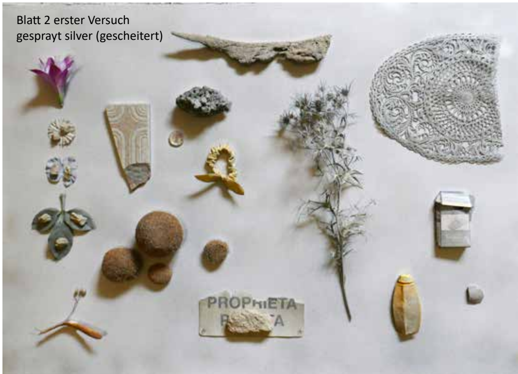
Blatt 2 erster Versuch gesprayt silver (gescheitert)