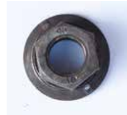
RADMUTTER MATERIAL: EISEN ALTER: ENDE 20. Jhd. FUNDORT: ROM