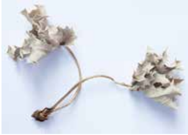
TROCKENBLÄTTER MATERIAL: ORGANISCH ALTER: 2021 FUNDORT: BUCHT VON BARATTI