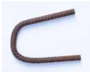
BETONSTAHL GEBOGEN MATERIAL: EISEN ALTER: ANFANG 21. Jhd. FUNDORT: PALESTRINA