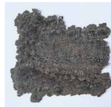
FRAGMENT UNBEKANNT MATERIAL: POLYESTERFASERN, KUNSTSTOFF ALTER: 2020 FUNDORT: BOMARZO