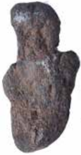
PRÄHISTORISCHE KULTFIGUR MATERIAL: VULKANGESTEIN ALTER: UNBEKANNT FUNDORT: VULCI