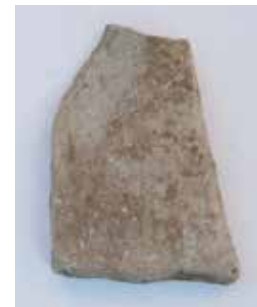
FRAGMENT BODENFLIESE MATERIAL: MARMOR ALTER: 1. Jhd. n. Ch. FUNDORT: VILLA ADRIANA - TIVOLI