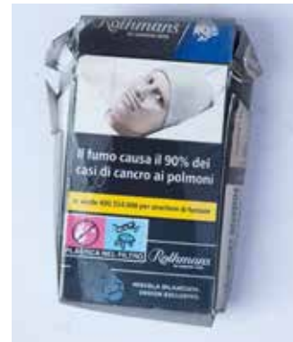
ZIGARETTENSCHACHEL MATERIAL: PAPIER / KARTON ALTER: JULI 2021 FUNDORT: BELLEGRA