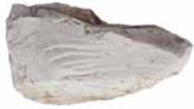
FOSSIELER FLÜGELABDRUCK MATERIAL: SEDIMENTGESTEIN ALTER: UNBEKANNT FUNDORT: PALIANO