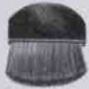
Small circular object, possibly a button or cap.