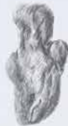
Small, irregular, textured object.