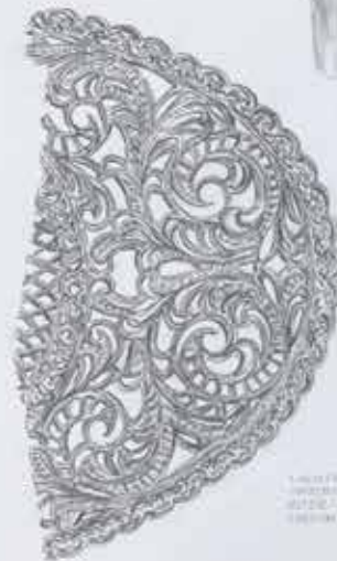
Large, intricate, lace-like object.