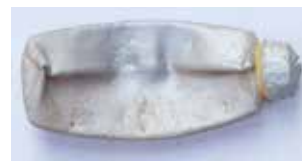
FARBTUBE MATERIAL: PLASTIK ALTER: ANFANG 20. Jhd. FUNDORT: PALIANO