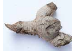
KAKTUSFRAGMENT MATERIAL: ORGANISCH ALTER: ANFANG 21. Jhd. FUNDORT: LIVORNO