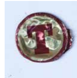
KRONKORKEN MATERIAL: METALL ALTER: ANFANG 21. Jhd. FUNDORT: ROM