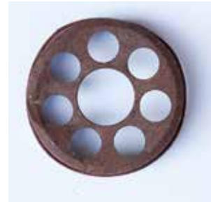
GRABLICHTDECKEL MATERIAL: EISENBLECH GESTANZT ALTER: ENDE 20. Jhd. FUNDORT: PALESTRINA