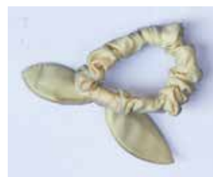
MATERIAL: KUNSTSTOFFGEWEBE ALTER: ANFANG 21. Jhd. FUNDORT: PALIANO