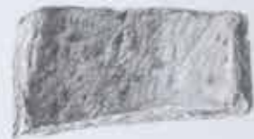
Rectangular object with a textured surface.