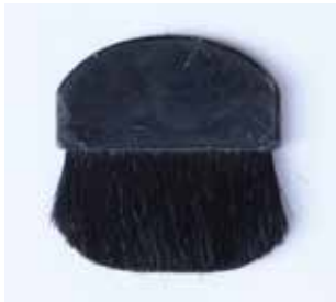
PUTZPINSEL MATERIAL: HARTPLASTIK UND KUNSTHAAR ALTER: 20. Jhd. FUNDORT: TUSCANIA