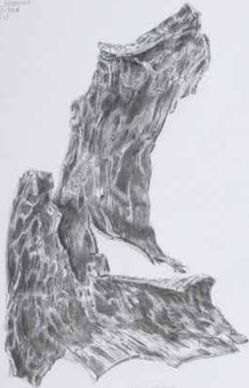
Large, irregular, textured object, possibly a piece of wood or bark.