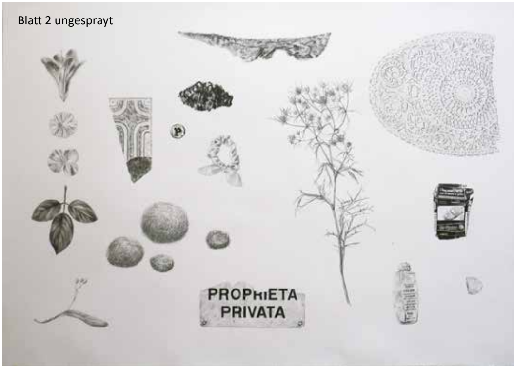
Blatt 2 ungesprayt