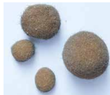
VOM WIND GEFILZTE GRAS – SANDKUGELN ALTER: 20. / 21. Jhd. FUNDORT: AM STRAND VON LIVORNO