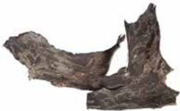
RINDE - SCHIRMPINIE MATERIAL: HOLZ ALTER: 20. Jhd. FUNDORT: CERVINARA / PALIANO