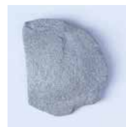
SCHABER MATERIAL: STEIN ALTER: UNBEKANNT FUNDORT: VULCI