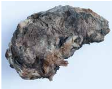
FRAGMENT EINES WURZELSTOCKES MATERIAL: PINIENHOLZ ALTER: ANFANG 21. Jhd. FUNDORT: CERVINARA / PALIANO