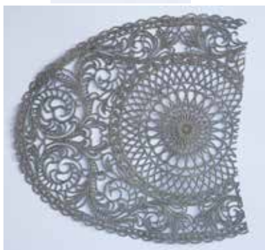
UNTERLEGDECKCHEN MATERIAL: KUNSTSTOFF ALTER: ANFANG 21. Jhd. FUNDORT: NEAPEL