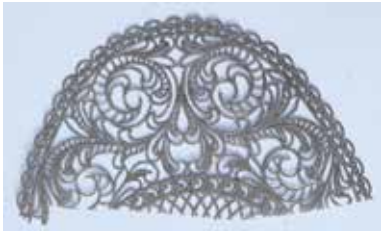
UNTERLEGDECKCHEN MATERIAL: KUNSTSTOFF ALTER: ANFANG 21. Jhd. FUNDORT: NEAPEL