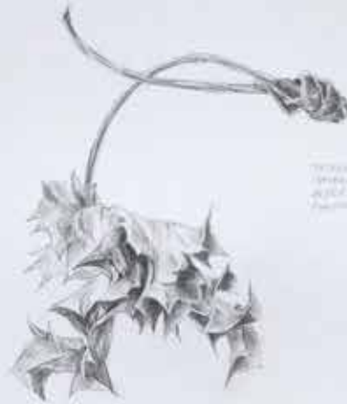
Plant specimen with leaves and a stem.