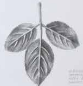
Plant specimen with three leaves.