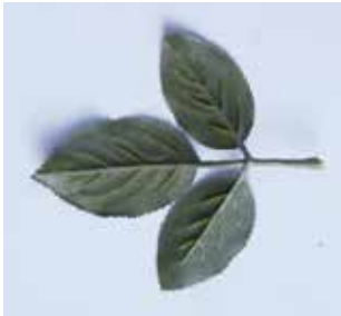
BLÄTTER MATERIAL: KUNSTSTOFF ALTER: ANFANG 21. Jhd. FUNDORT: FRIEDHOFSTIEGE BELLEGRA