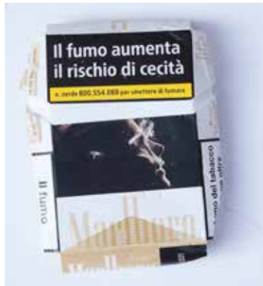
ZIGARETTENSCHACHEL MATERIAL: PAPIER / KARTON ALTER: JULI 2021 FUNDORT: VITERBO