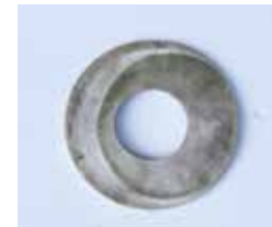
DICHTUNGSRING MATERIAL: GUMMI MIT DUNKLEN GEBRAUCHSSPUREN ALTER: ANFANG 21. Jhd. FUNDORT: GENUA