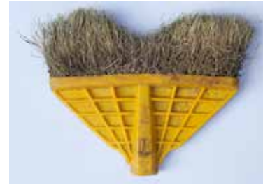
BESEN MATERIAL: KUNSTSTOFF ALTER: ANFANG 21. Jhd. FUNDORT: CERVINARA / PALIANO