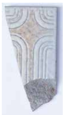
FLIESENFRAGMENT MATERIAL: TON GEBRANNT / GLASIERT ALTER: ENDE 20. Jhd. FUNDORT: SUBIACO / S. BENEDETTO