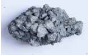
ASPHALTKLUMPEN KLEIN MATERIAL: GESTEIN / TEER ALTER: 21. Jhd. FUNDORT: BEI MONESTER S. BENEDETTO