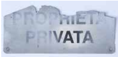
HINWEISSCHILD MATERIAL: KUNSTSTOFF ALTER: ENDE 20. Jhd. FUNDORT: CERVINARA / PALIANO