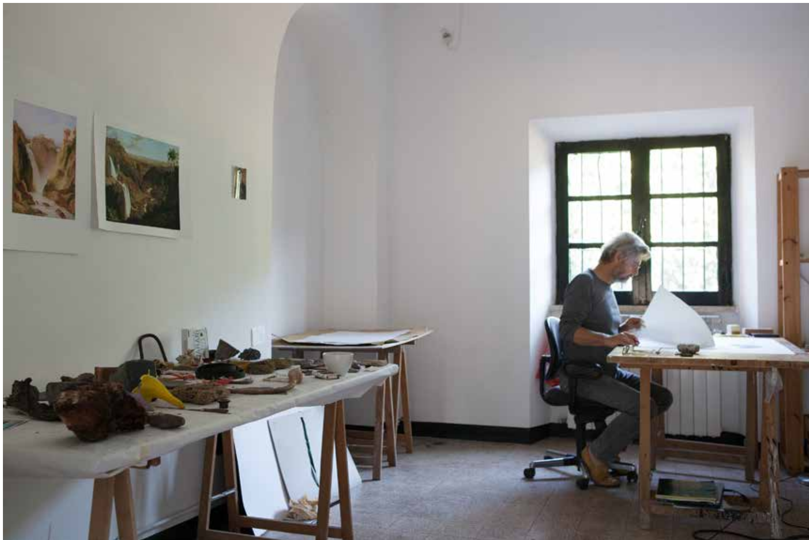
Atelier Paliano_August 2021

Dank an das Land OÖ für den Atelieraufenthalt an diesem besonderen Ort in Paliano.