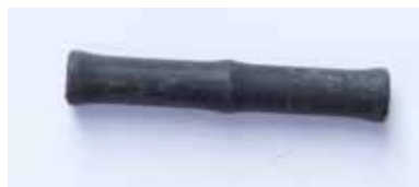
TRAGEGRIFF MATERIAL: KUNSTSTOFF ALTER: ENDE 20. Jhd. FUNDORT: TIVOLI