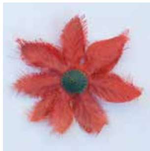
STOFFBLUME MATERIAL: KUNSTSTOFFGEWEBE / PLASTIK ALTER: ENDE 20. Jhd. FUNDORT: NEAPEL