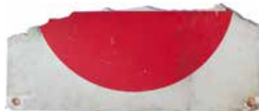
VERKERSSCHILD FRAGMENT MATERIAL: PLASTIK ALTER: 20. Jhd. FUNDORT: CERVINARA / PALIANO