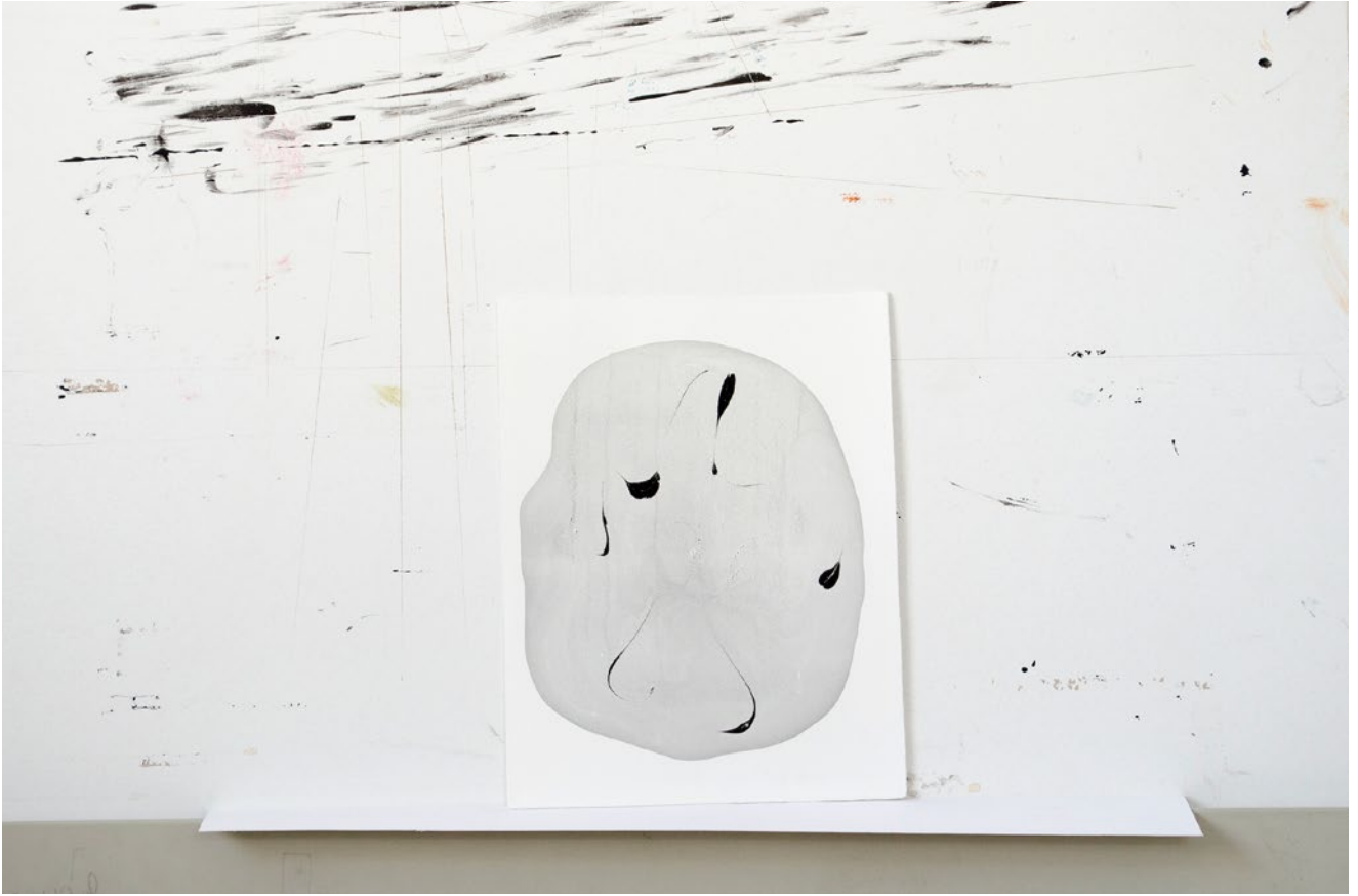
ohne Titel, marmoriertes Büttenpapier, je 26,5 cm x 20,5 cm, 2018