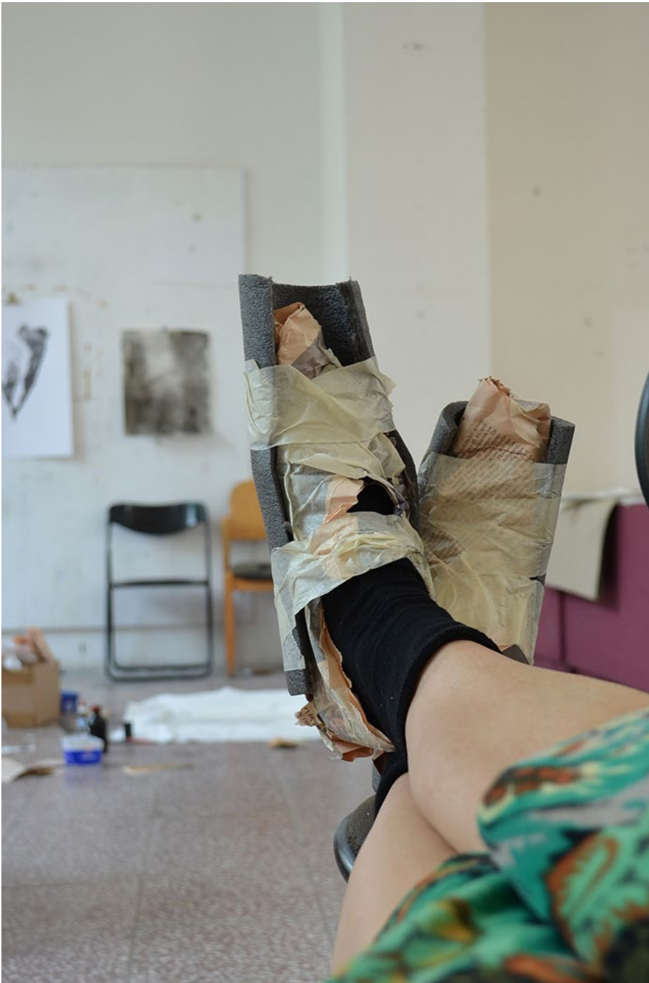
Atelierpantoffeln made in C.K.