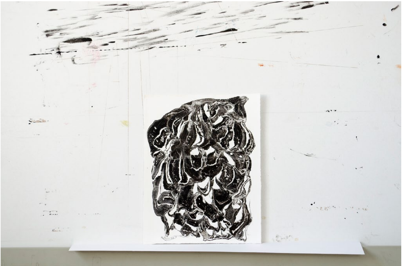
ohne Titel, marmoriertes Büttenpapier, 26,5 cm x 20,5 cm, 2018