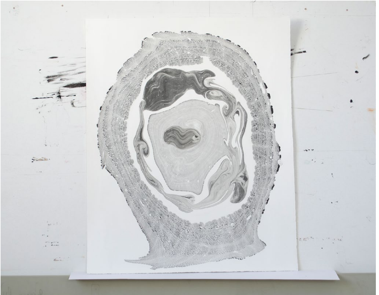
ohne Titel, marmoriertes Büttenpapier, 40 cm x 50 cm, 2018