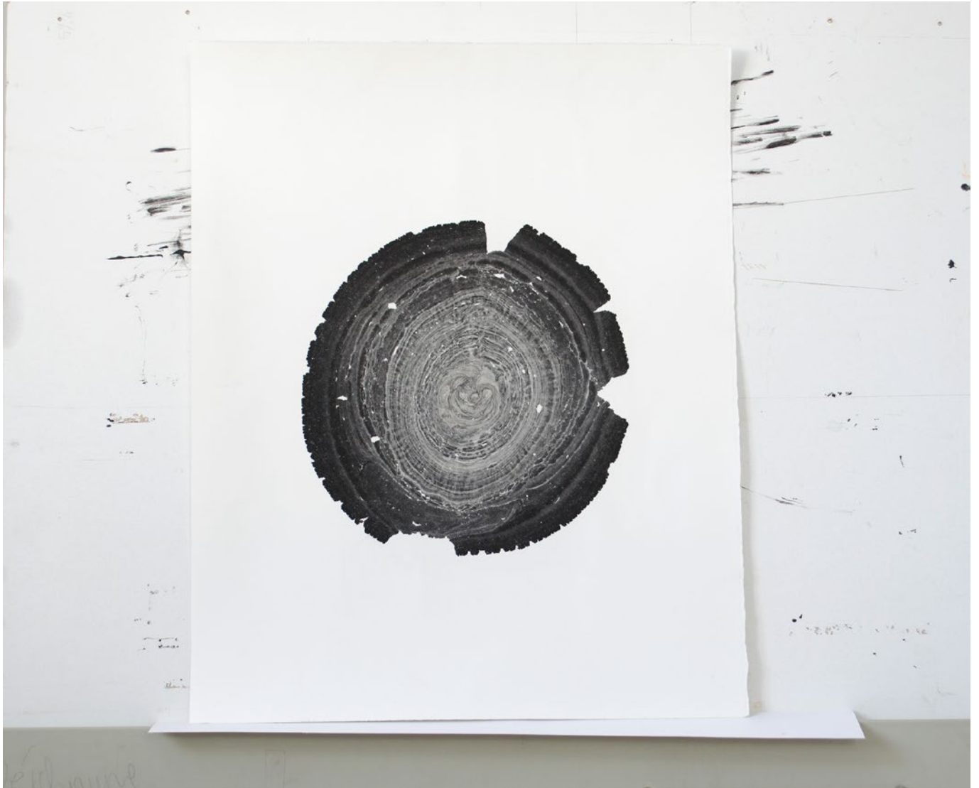
ohne Titel, marmoriertes Büttenpapier, 50 cm x 40 cm, 2018