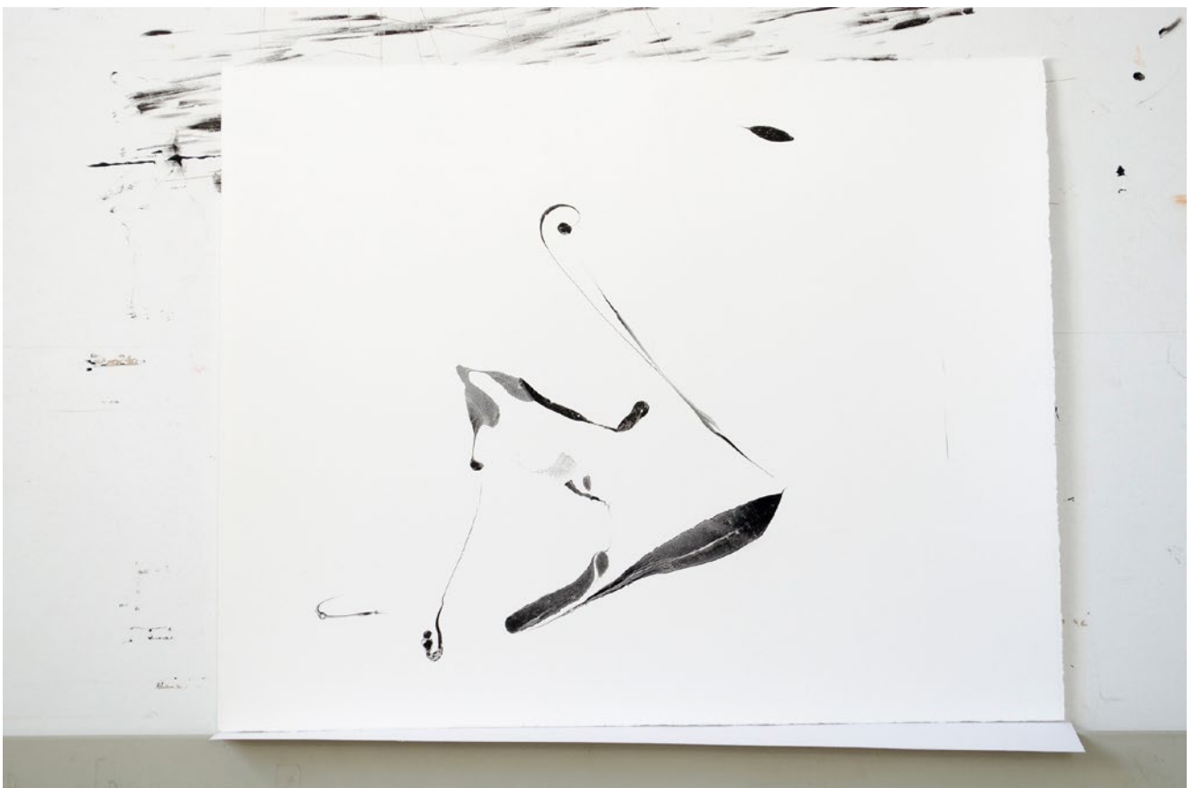
ohne Titel, marmoriertes Büttenpapier, 40 cm x 50 cm, 2018

Ich habe diese Technik abgewandelt und versuche sie in meinen künstlerischen Kanon zwischen Zeichnung und Druckgrafik einzufügen. Die schwimmenden Farben sind schwer kontrollierbar und es bedarf einiger Erfahrung um brauchbare Ergebnisse zu erzielen. Im Folgenden eine kleine Auswahl an "Abzügen" die in Krumau entstanden sind.