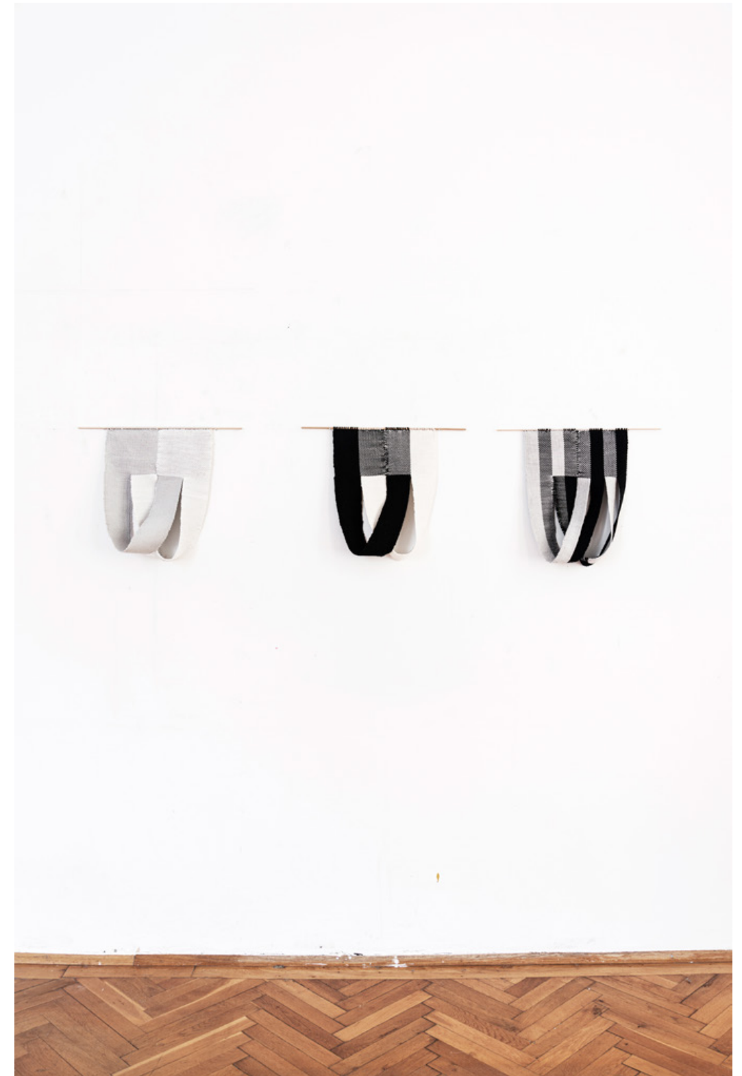
vorherige Seite Bandobjekt, 2026 Baumwolle, Holzstab, ca. 50 x 40 cm