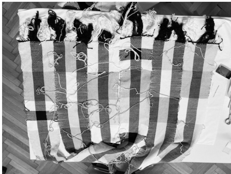
nächste Seite Bandstruktur, 2026, Baumwolle, Aluminiumstab, ca. 90 × 100 cm

Als Weiterentwicklung der kleineren Bandobjekte habe ich mich entschieden, eine Arbeit mit größeren Dimensionen zu schaffen, indem ich einzelne Bänder zusammenfüge. In diesem Fall sind es drei 15 cm breite und ca. 180 cm lange gewebte Bahnen. Dabei wollte ich mit den verschiedenen Grautönen und den Kombinationen aus Kette- und Schussfarbe spielen. Durch das Zusammennähen der unterschiedlich gemusterten Bänder soll sich ein neuer Rhythmus und eine neue Qualität ergeben.