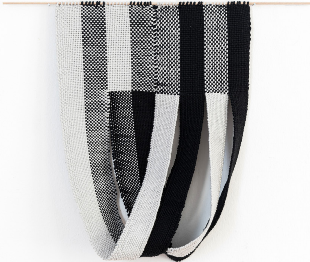
Drei Bandobjekte, 2026 Baumwolle, Holzstab, je ca. 50 x 40 cm Atelier 7, Villa Rabl