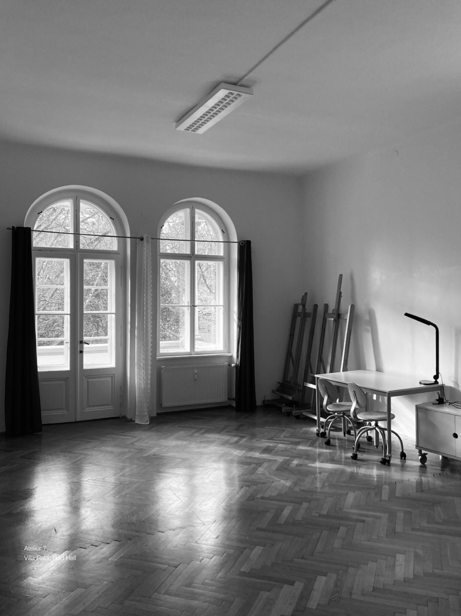
Atelier 7, Villa Rabi, Bad Hall