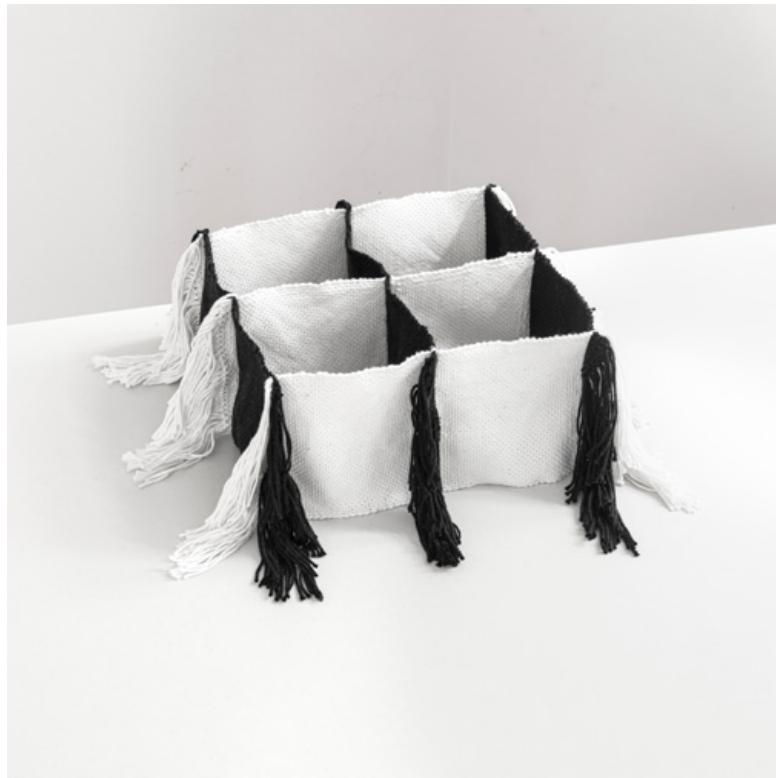
Weiches Gitter, 2026 Baumwolle ca. 15 x 30 x 30 cm

Die folgende Gitterstruktur besteht aus neun einzelnen, jeweils ca. 15 cm breiten und 30 cm langen Bändern, deren Ketten während des Webprozesses schrittweise ineinander gefädelt wurden. An den Knotenpunkten der weißen und schwarzen Bahnen entstanden die Kettfransen.