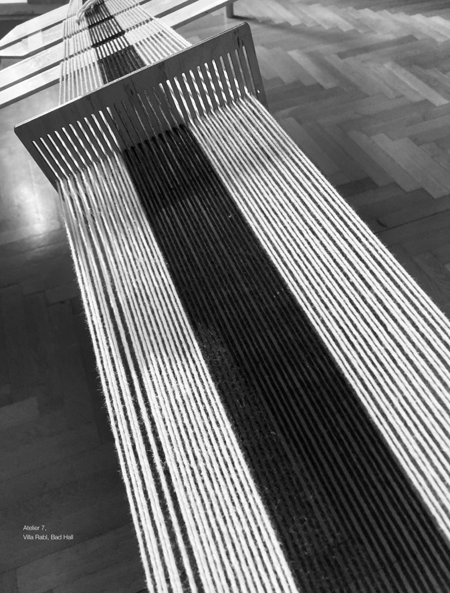
Atelier 7, Villa Rabl, Bad Hall