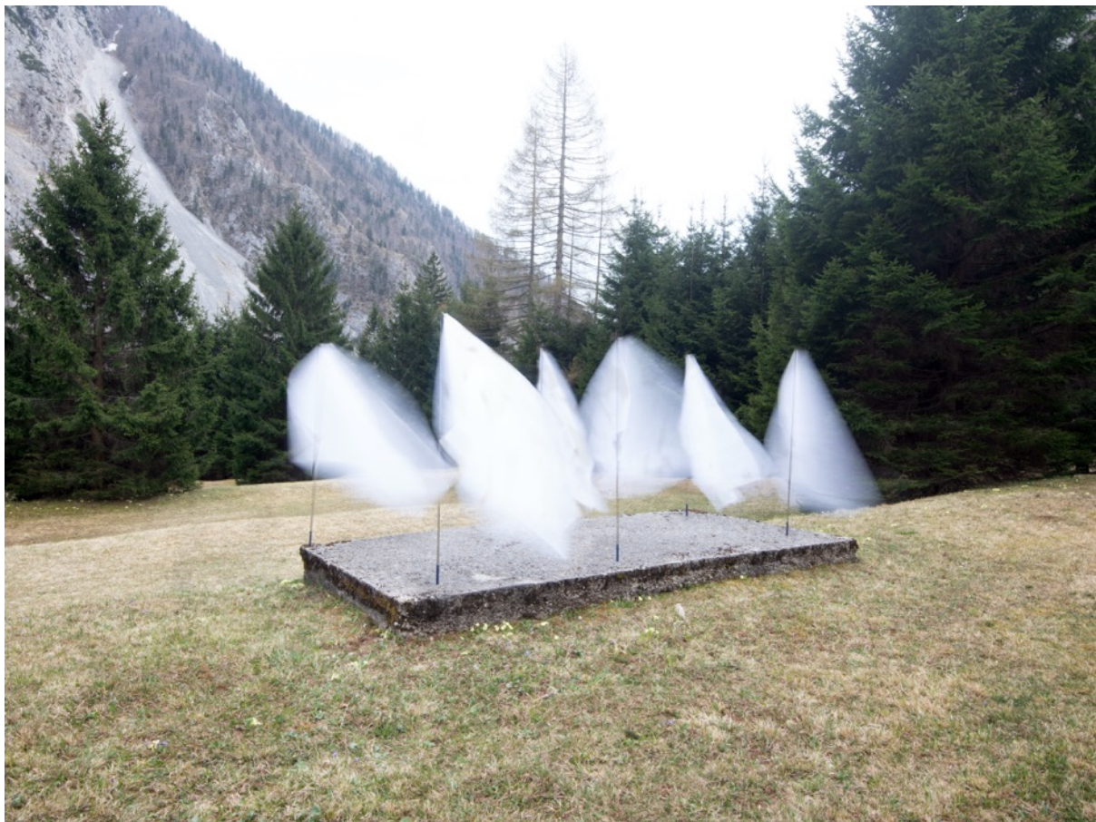
Künstlerische Interventionen: ehemalige Häftlingsbaracken im KZ-Außenlager Loibl-Süd