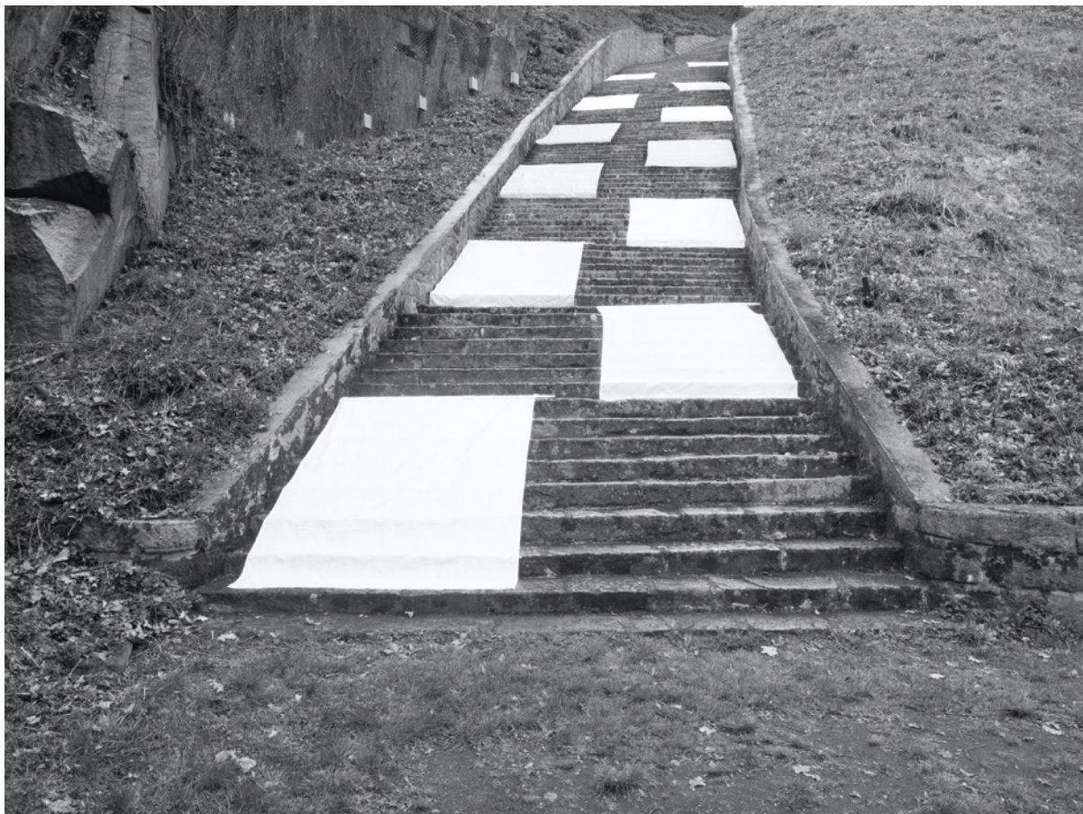
Künstlerische Interventionen in der KZ-Gedenkstätte Mauthausen