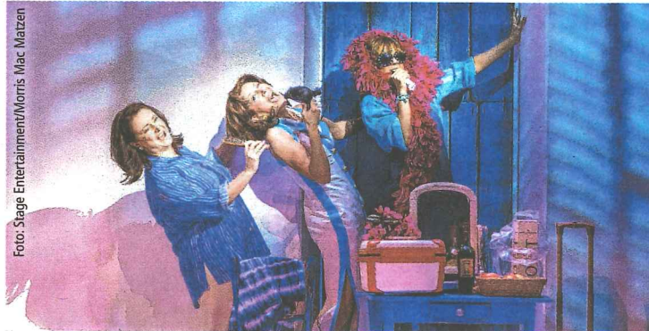
„Mamma Mia!“ ist von 13. Juli bis 5. August im Musiktheater zu sehen.

22 Superhits von ABBA wie „Dancing Queen“, „Take a chance on me“ und natürlich „Mamma Mia!“ erzählen die Geschichte so raffiniert, als ob sie eigens für das Stück geschrieben worden wären. Dadurch entstand ein furioses