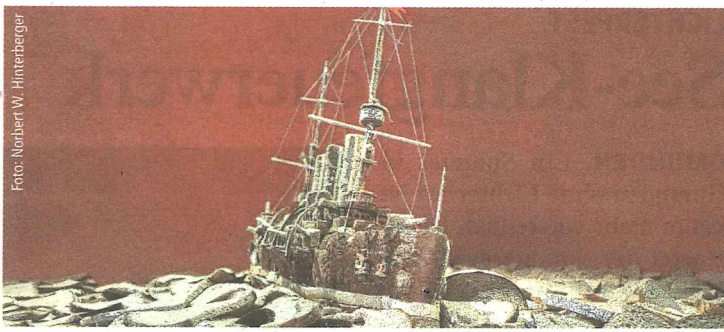
Hinterbergers Modell des Panzerkreuzers „Aurora“ aus Weiß- und Schwarzbrot

Karten gibt's online unter www.landestheater-linz.at , Tel. 0732/7611-400; bis 15 Jahre gibt's 50 Prozent Ermäßigung