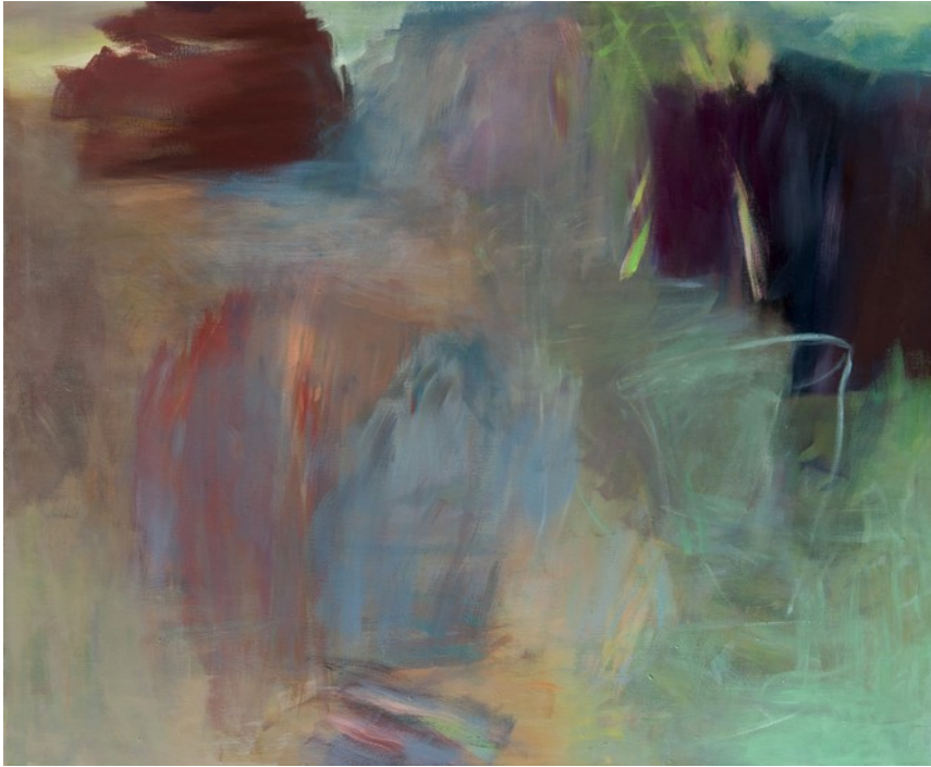
o.Titel, Acryl auf Leinwand 2019 90 x 110 cm © Erich Goldmann